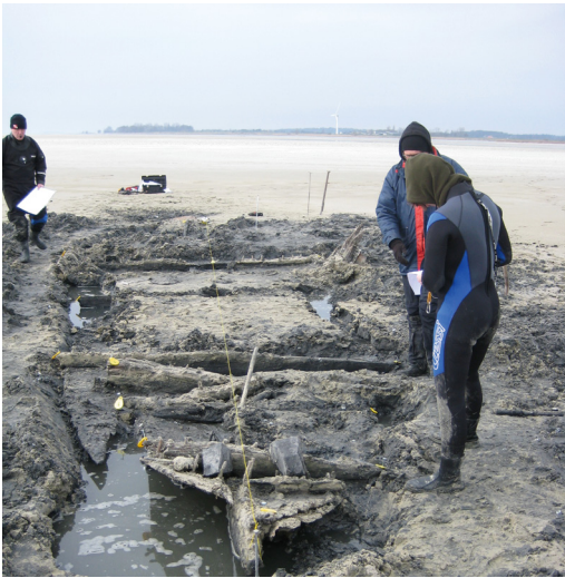
Opmeten van het wrakje.

Een melding in 2007 van Rijkswaterstaat bij toenmalige RACM (nu RCE) van een wrakje op Steile Bank was aanleiding een eerste verkenning hier naar uit te voeren. Het gemelde wrak op Steile Bank was niet bereikbaar vanaf het betond vaarwater, omdat het in het verboden natuurgebied van It Fryske Gea ligt. Om het wrak te onderzoeken is toestemming bij It Fryske Gea gevraagd en voor een zeer korte periode in 2010 verkregen. Het wrak is vier keer bezocht, waarbij de mogelijkheden voor een uit te voeren onderzoek sterk door de weerssituaties werden vaak werden bemoeilijkt. Op 13 maart 2011 was, door de lage waterstand, een uitgebreid onderzoek van het wrak mogelijk. Het moest echter eerst uitgegraven worden, waarna het is opgemeten en diverse details zijn opgenomen. Van het wrak is alleen een groot deel van het vlak met het daarop aanwezige mastspoor nog aanwezig. De lengte van het wrak bedraagt ca. 12,50 m; de breedte ca. 3,75 m. De twee nog aanwezige stukken boord en het zichtbare deel van de voorsteven is met plaat bekleed. Dit kan er op duiden dat het scheepje redelijk oud was en dat de onderhoudstoestand slecht moet zijn geweest. De aanwezige wrakdelen zijn sterk aangetast door mechanische invloeden, die toegeschreven kunnen worden aan het 's winters in dit gebied voorkomend kruierend ijs.