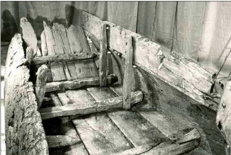
Afb. 3: Reconstructie Meinerswijk 3

Al eerder, in 2005, werden verkenningsduiken uitgevoerd. Hierbij zijn meetpunten en markeringslint van het eerder uitgevoerde onderzoek teruggevonden. Toevalligerwijs op min of meer hetzelfde moment kwamen de eerder geborgen resten bij de Rijksdienst voor het Cultureel Erfgoed uit de conservering. Ook de wens om meer ervaring op te doen met restauratie en meer te weten te komen over schip en scheepstype, leidden tot de hernieuwde aandacht. We hebben met behulp van prikkers geprobeerd het wrakje te lokaliseren door op een centrale plaats met de 'cirkelzoekmethode' te zoeken. Hierbij wordt een touw aan een paaltje bevestigd, waarna de duiker in cirkels de bodem afzoekt. Deze methode had al snel resultaat.