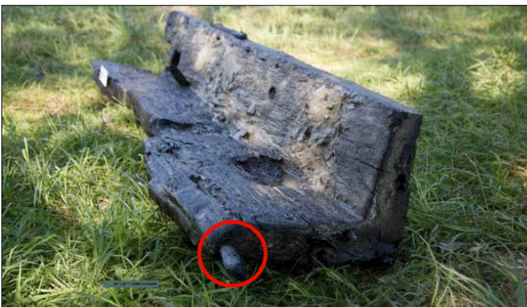
Afb. 2: Bakboord kimstuk, omcirkeld uitstekende pen van achterspiegel

"Om overzicht te krijgen, hebben we gehoopt dat het ditmaal redelijk zicht zou zijn. Gewapend met meetlint en schrijfgerei zijn we te water gegaan. Het zicht bleek beter dan de afgelopen weken te zijn. Bij de eerste blik zag ik al dat het wrakje er totaal anders bij ligt dan we eerder gedacht hadden. De vlakplank waarvan ik dacht dat deze doorliep tot onder in de put bleek niet de linker te zijn, maar is de meest rechtse! We zien dat de vlakdelen met sintels aan elkaar vast hebben gezeten. De meeste sintels zijn gebroken, maar liggen nog wel tegenover elkaar. Ook het eerste spant van boven bleek niet op het hele vlak vast te zitten. Het spant is meer dan 1 m lang en heeft op 35 cm van elkaar pengaten zitten. Een pen zit in het afgebroken einde van het spant aan de noordkant. Een andere pen zit nog in de vlakplank die ernaast ligt. Verder naar het zuiden zit nog een pengat in het spant. Het spant verdwijnt hier in de grond; hij ligt nog niet helemaal vrij. Het deel dat van het spant is afgebroken, ligt aan de noordkant in het zand. De spant is op het pengat afgebroken. We hebben het stuurboord-boord opgemeten. Het is ongeveer 2,04 m in lengte, 0,5 m in hoogte, 0,33 m in breedte en is 0,12