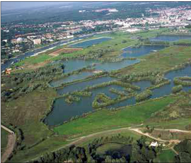
Afb. 1: Meinerswijk ten zuiden van Arnhem

De Meinerswijkse polder maakt deel uit van een uitgestrekt uiterwaardenlandschap ten zuiden van de Nederrijn in Arnhem. Bij de aanleg van de zogeheten 'Plas van Bruil', later 'Spiegelplas' genaamd, werden in de jaren '70 scheepsresten aangetroffen waarna de Rijksdienst voor de IJsselmeerpolders (RIJP), onder auspiciën van de Rijksdienst voor het Oudheidkundig Bodemonderzoek (ROB, nu Rijksdienst voor het Cultureel Erfgoed) een onderzoek startte. In totaal zijn er toen resten van drie rivierschepen gevonden. Van het schip aangeduid als "boomstamschip" of wel Meinerswijk 3 is het voorste deel gevonden. Het achterste deel werd na meerdere zoekacties voor verloren gewaand. Tot 2006, toen duikers van de Landelijke Werkgroep Archeologie Onder Water (LWAOW) de resten alsnog vonden.