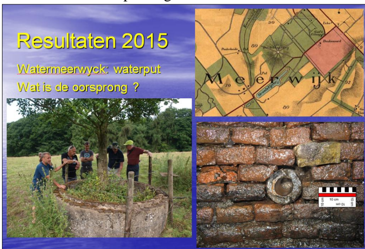
Onderzoek naar een oude waterput

Na een korte koffiepauze gaf Bas Kremer een overzicht van het ingediende plan. Via Making Waves, dat de mogelijkheid biedt voor growdfunding, wil de groep een sonaronderzoek uitvoeren op Paessensrede en Smeriggat in de Waddenzee. Over de mogelijke aanwezigheid van wrakken is in dit gebied weinig bekend. Hij gaf aan, na het uitgevoerde onderzoek, mogelijk volgend jaar hier meer over te kunnen vertellen.