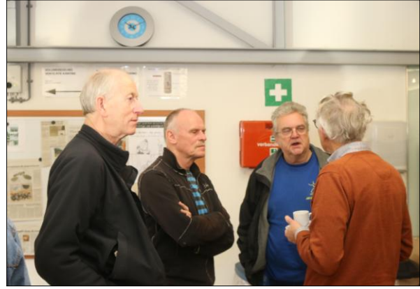
Nog Even bijpraten.....