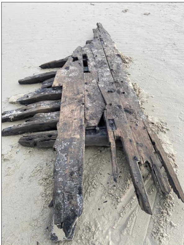
Het aangespoelde wrakdeel. Getekend en keurig in hergebruik als tuinaankleding.

Op 1 januari van dit jaar lag er ineens met laag water een stuk van een houten schip op het strand nabij paal 5 op het Terschellinger Noordzeestrand. In de loop van de dag kreeg ik daar een melding van via facebook. Helaas hadden een paar gemotoriseerde jutters het stuk scheepshuid met spanten al op sleeptouw genomen in de richting van de bewoonde wereld. Hierbij zijn diverse leuke delen afgerukt en achtergebleven. Hier kon ik het samen met Wouter Waldus (met vakantie!) van RCE bekijken. Het leek de moeite waard om het stuk te tekenen. Daarvoor is het met een heftruck naar een loods gebracht waar ik het verder kon meten.