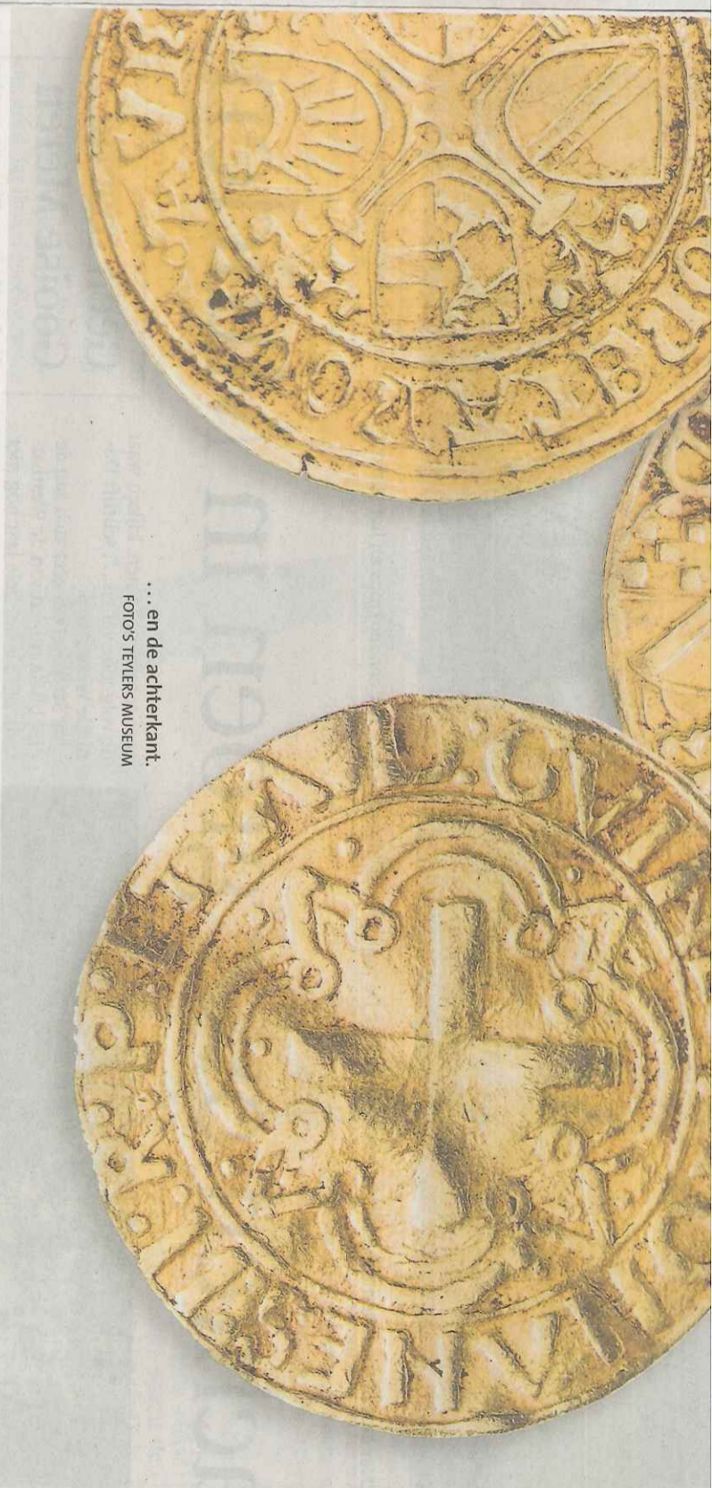
en de achterkant.