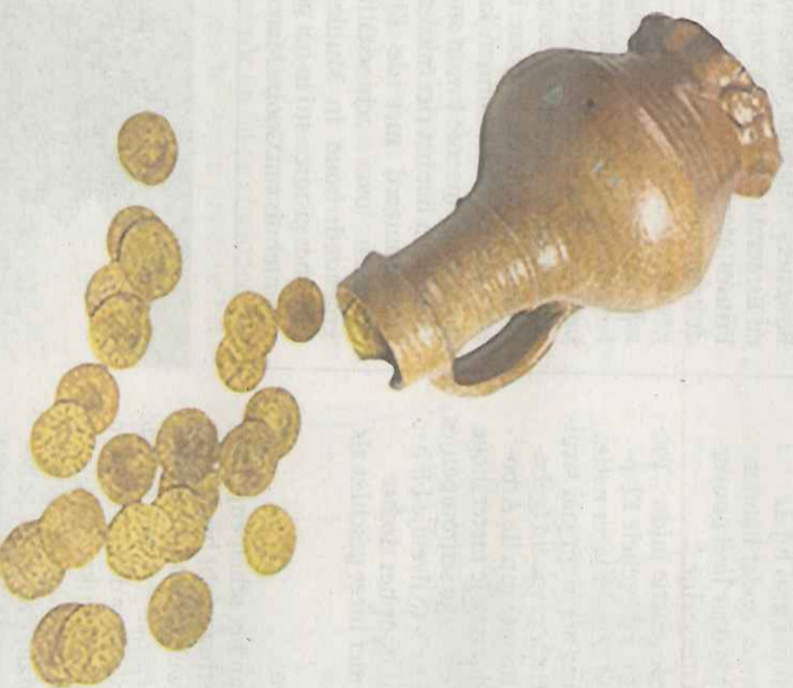
Het 15e-eeuwse kannetje met inhoud.

We schrijven oorlogsjaar 1941. Tijdens het graven stuiten ze 'een spijt diep in de grond' op een steenen kannetje met daarin 28 gouden munten. Via plaatsgenoot Henk Aalberts belandden ze bij het Centraal Museum in Utrecht en uiteindelijk bij de destijds bekende numismaat (muntendeskundige) Schulman. Deze taxeerde de waarde van de middeleeuwse vondst op