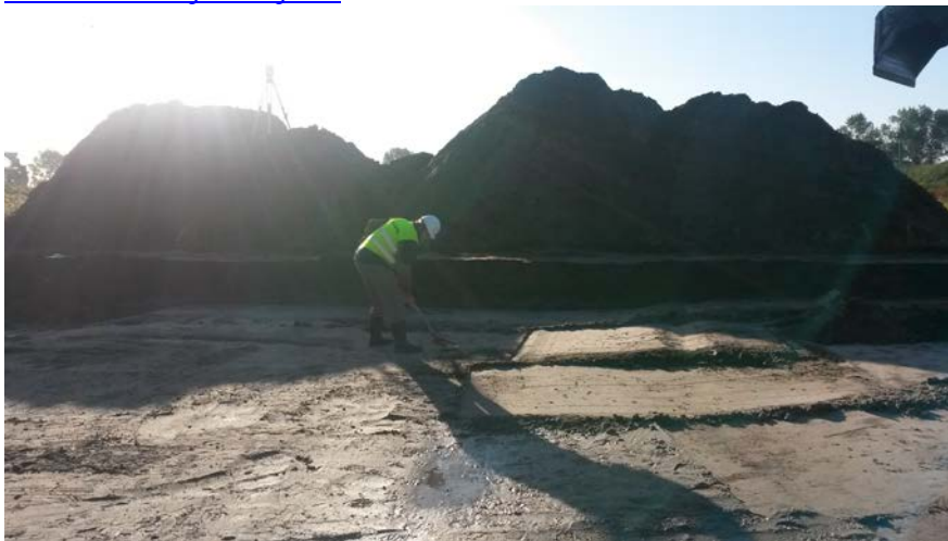
Aanleggen van de put