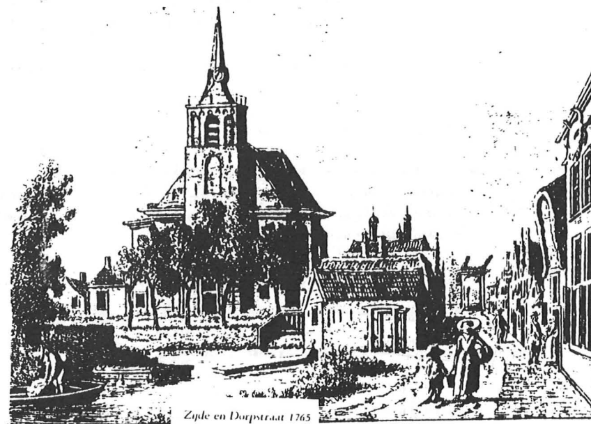
Zijde en Dorpsstraat 1765

Op de plaats van de huidige kerk heeft een kerk gestaan die in 1895 door brand is verwoest.