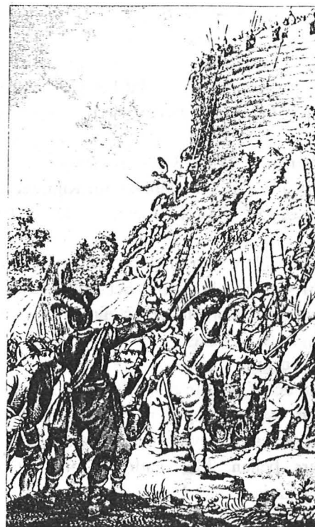
"Gravinne Ada op de Burgt te Leyden belegerd", gravure door R. Vinkeles naar J. Buys, 1785.