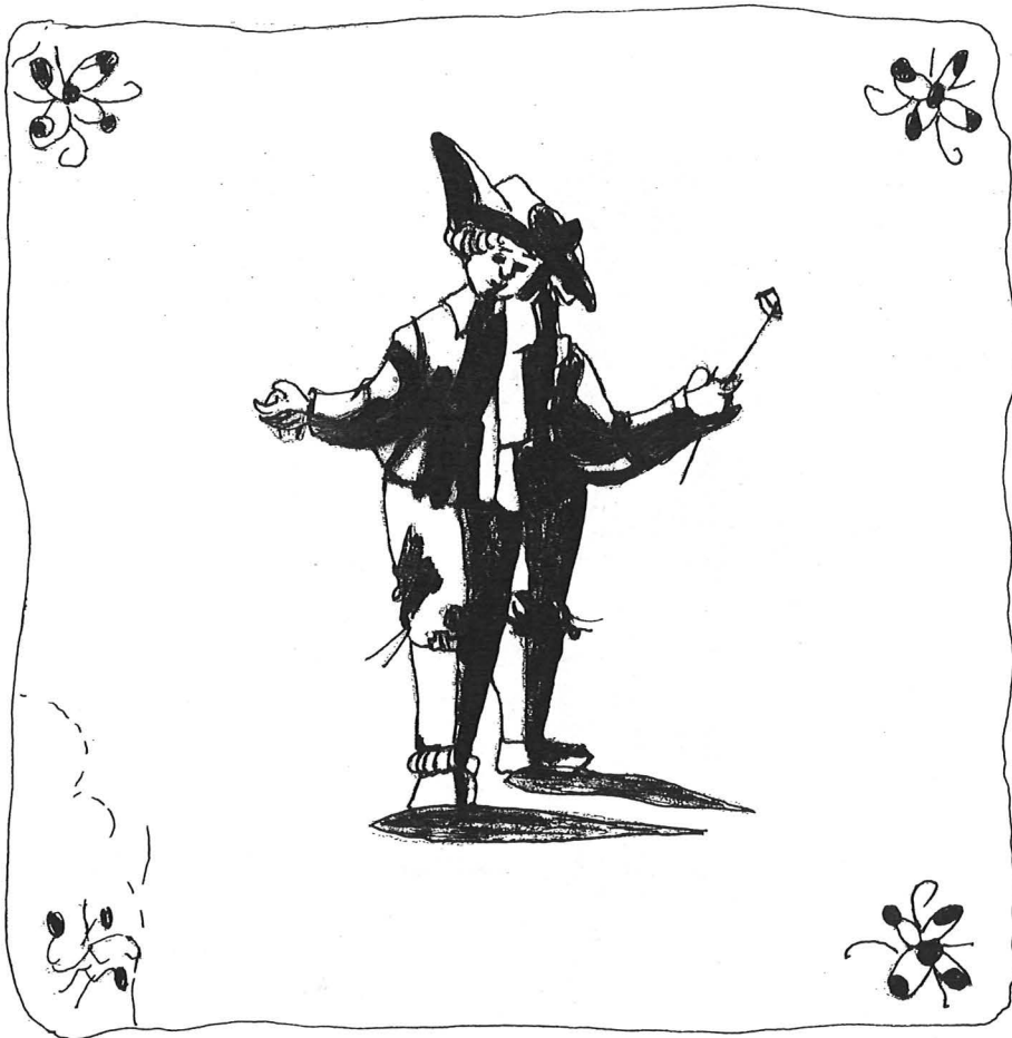
Drie afbeeldingen van de te Voorschoten (Voorstraat) gevonden wandtegels. Tekeningen: Carla van Veen.