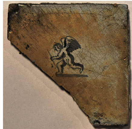
Een kookpot en tegel uit de vijver van kasteel Endegeest, gerestaureerd bij de Archeohotspot Oegstgeest

Een andere ontwikkeling is wat ik maar eenvoudig ‘grondradar’ zal noemen, maar er zijn meerdere technieken bij betrokken. In ieder geval is het non-destructief onderzoek, waarbij met name de samenstelling van de grond in beeld gebracht wordt. Als er funderingen of dergelijke in de grond zitten, geven die op de radarbeelden een bepaalde kleur. Overigens is het interpreteren van al die verkregen gegevens best wel een dingetje: dat leer je niet in vijf minuten... Maar het initiatief van met name de afdeling Kempen en Peelland, dat leidde tot de aanschaf van de betreffende apparatuur en de oprichting van de landelijke WGMA, ondervond veel weerklank. Voor niet-destructief onderzoek hoef je niet zoveel vergunningen te hebben als bij een opgraving; uiteraard is wel de medewerking van de eigenaar of huurder van de