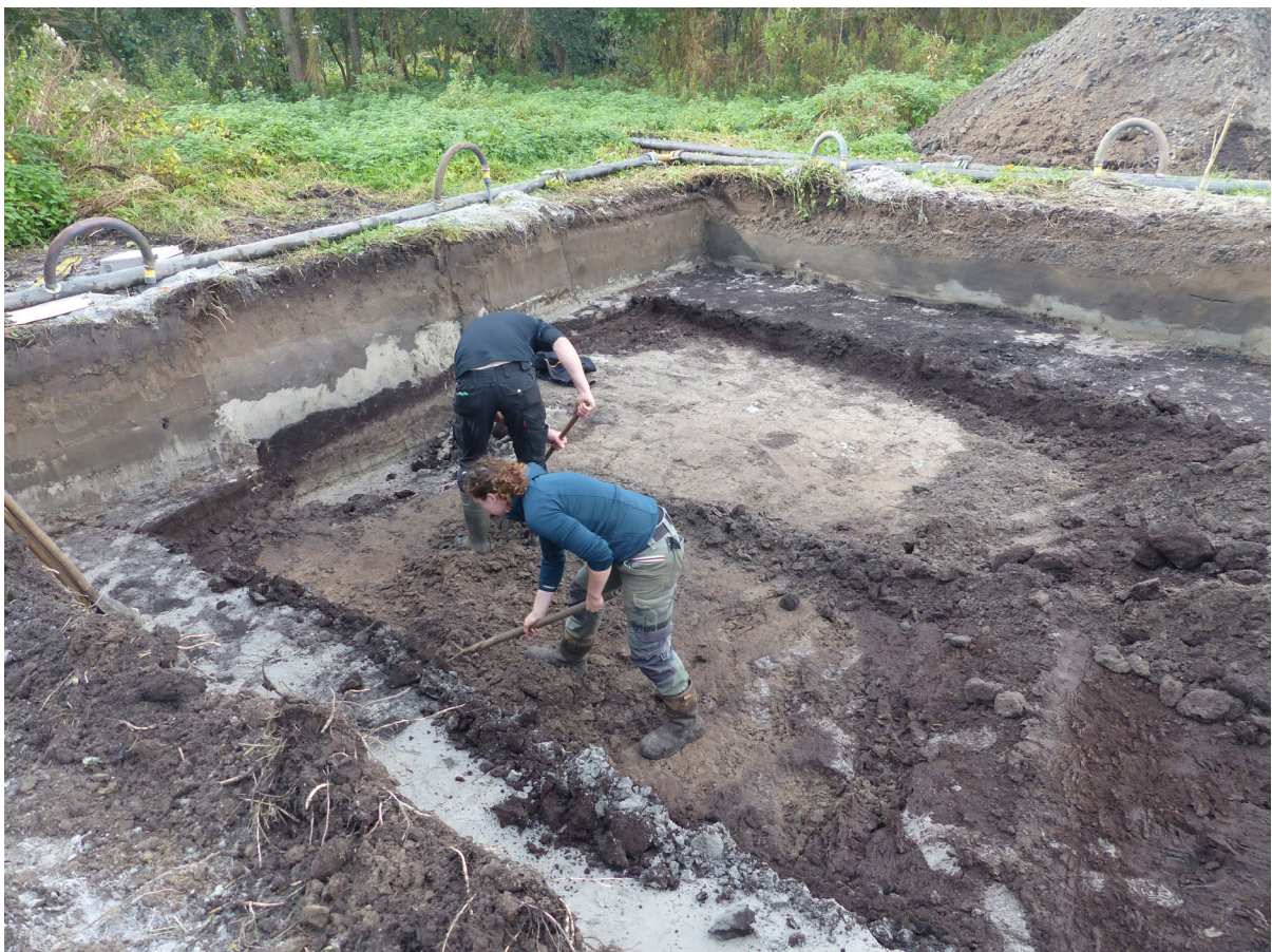
SOB-archeologen druk aan het werk.

Ook goed zichtbaar waren in de sleuven de verschillende overgangen van zand- naar veenlagen. Verdere vondsten bleven beperkt tot een enkele scherf uit de Nieuwe Tijd.