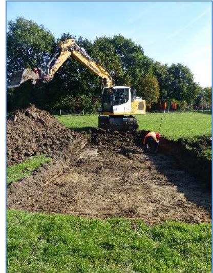
Sleuf 3 wordt opengelegd.