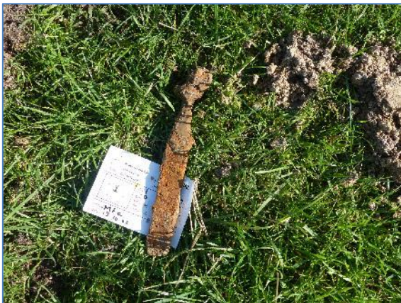
Ondefinieerbaar stuk ijzer

Er is voor het schelpengruis nog een andere verklaring mogelijk. Bekend is dat er een doorbraak heeft plaatsgevonden vanaf de Oude Rijn. De Romeinen hebben mogelijk schepen gestuurd naar Katwijk om bij het strand zand en schelpen op te halen. Daarna zijn ze teruggevaren en hebben hun lading in het gat gestort waarna de schepen als extra versteviging zijn gebruikt. In de jaren '70 van de vorige eeuw zijn daar de zogenaamde Zwammerdamschepen opgegraven. Deze schepen worden op dit moment in het Archeon gereconstrueerd.