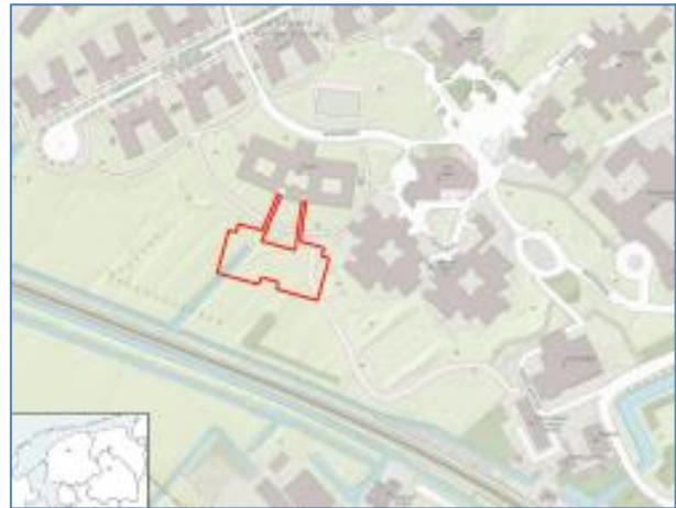
Het rood omlijnde onderzoeksgebied bij Ipse

Opravingbedrijf Den Ouden Bodac uit 's-Hertogenbosch zou op het terrein van Ipse de Bruggen drie proefsleuven aanleggen. Toen ik rond het middaguur kwam kijken waren de archeologen net middagpauze aan het houden. Ik zag dat de eerste proefsleuf alweer dichtgegooid was.