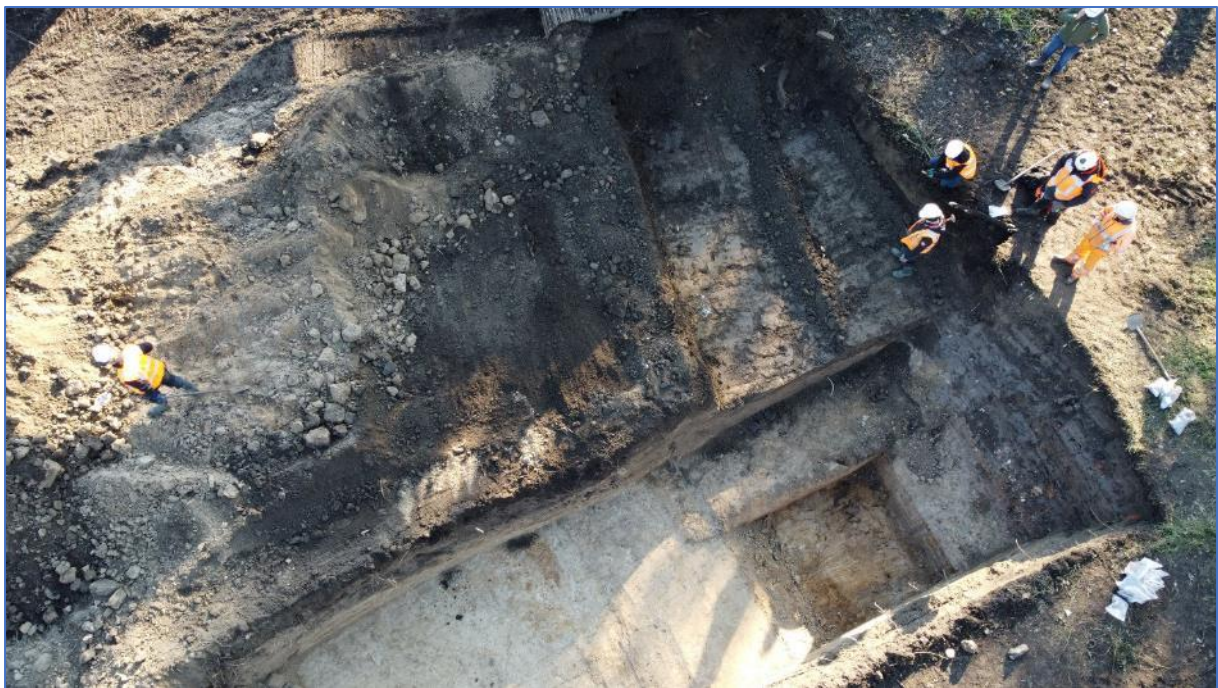
Foto van de proefsleuven, genomen met de drone van de AWN