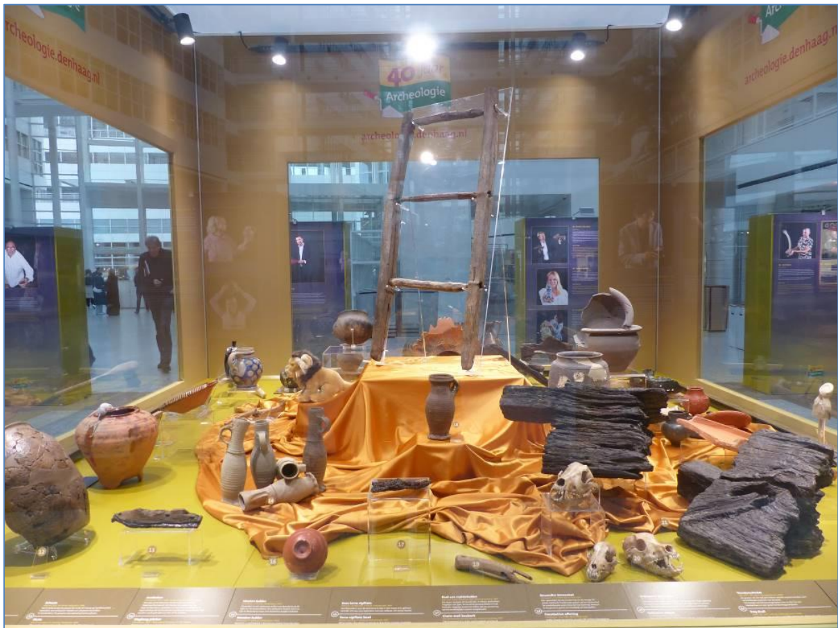
Vitrine, een voorbeeld wat er te zien was

Ook nog te zien was een Werra-schotel van goedkoop, roodbakend aardewerk, gemaakt in Duitsland. Het aardewerk is versierd met gele en groene accenten en ingekraste motieven: planten, dieren of personen en vaak met een jaartal, in dit geval 1599.