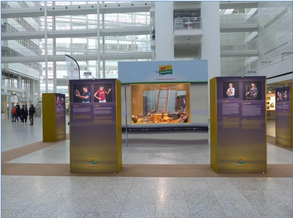
Overzicht van 40 jaar Archeologie, tentoonstelling in het Haagse stadhuis

Van 17 oktober tot en met 18 november 2022 stond in het Atrium van het stadhuis in Den Haag de jubileumtentoonstelling centraal over 40 jaar Archeologie in Den Haag. In deze tentoonstelling was niet alleen te zien wat er zo allemaal in Den Haag gevonden is, maar werden ook de mensen voorgesteld die zich dagelijks bezighouden met het bijzondere werk van archeologie. De 40 meest aansprekende voorwerpen werden in deze expositie getoond.