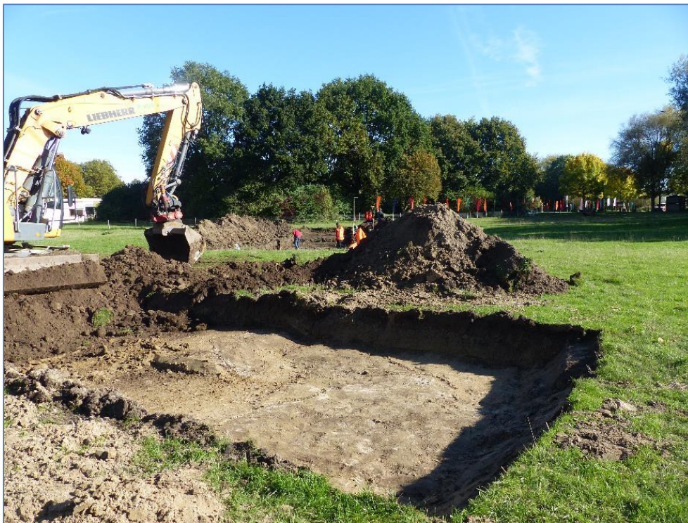
Sleuf 2 wordt dichtgegooid, op de achtergrond wordt druk in sleuf 3 gewerkt

Er komt een vervolgonderzoek, waarschijnlijk een opgraving van de bedreigde stukken waar nieuwe paviljoenen voor de bewoners van Ipse de Bruggen worden gebouwd.