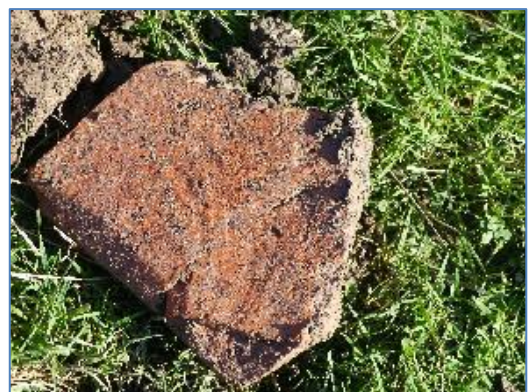
Fragment tegula met signatuur