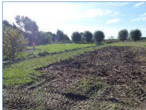
Sleuf 1 (alweer dichtgegooid)

Het doel van dit onderzoek was om de vicus van het castellum Nigrum Pullum op te sporen en een hoekpunt van het castellum te vinden, zodat het castellum beter ingemeten zou kunnen worden. In de jaren '70 van de vorige eeuw was dat namelijk minder goed gebeurd. De archeoloog vertelde dat het onderzoek in de eerste sleuf weinig tot niets had opgeleverd. Geen sporen en amper scherven, enkel een paar stukken bouw materiaal. In sleuf twee, die nog open lag, eigenlijk hetzelfde verhaal. Weinig sporen, weinig vondsten, wel plekken waar schelpafzettingen te zien waren. Een eerste indruk was dat veel verspoeld leek.