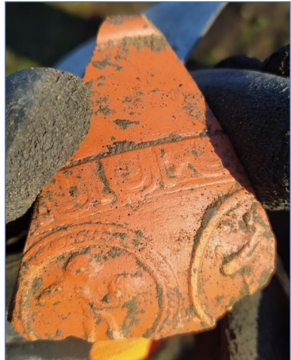
Een versierd stuk terra sigillata met o.a. een eierrand