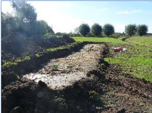
Sleuf 2 open