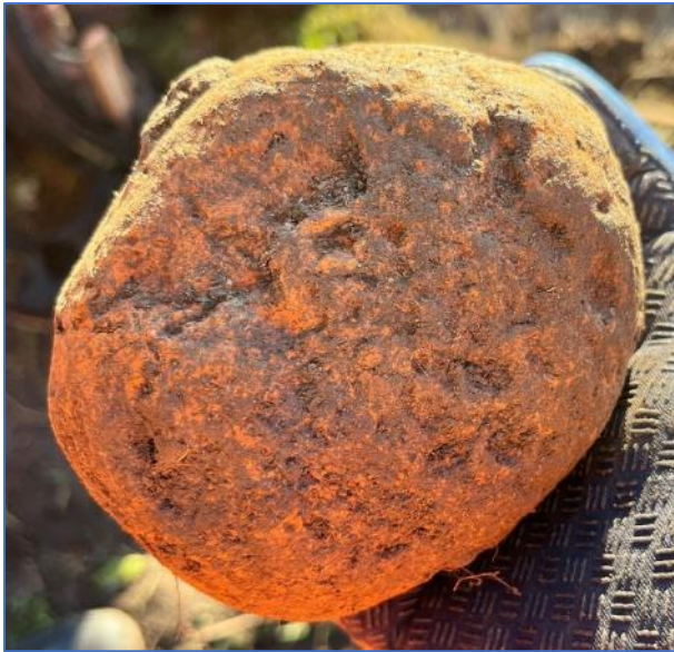
Een Romeinse keramische slingerkogel