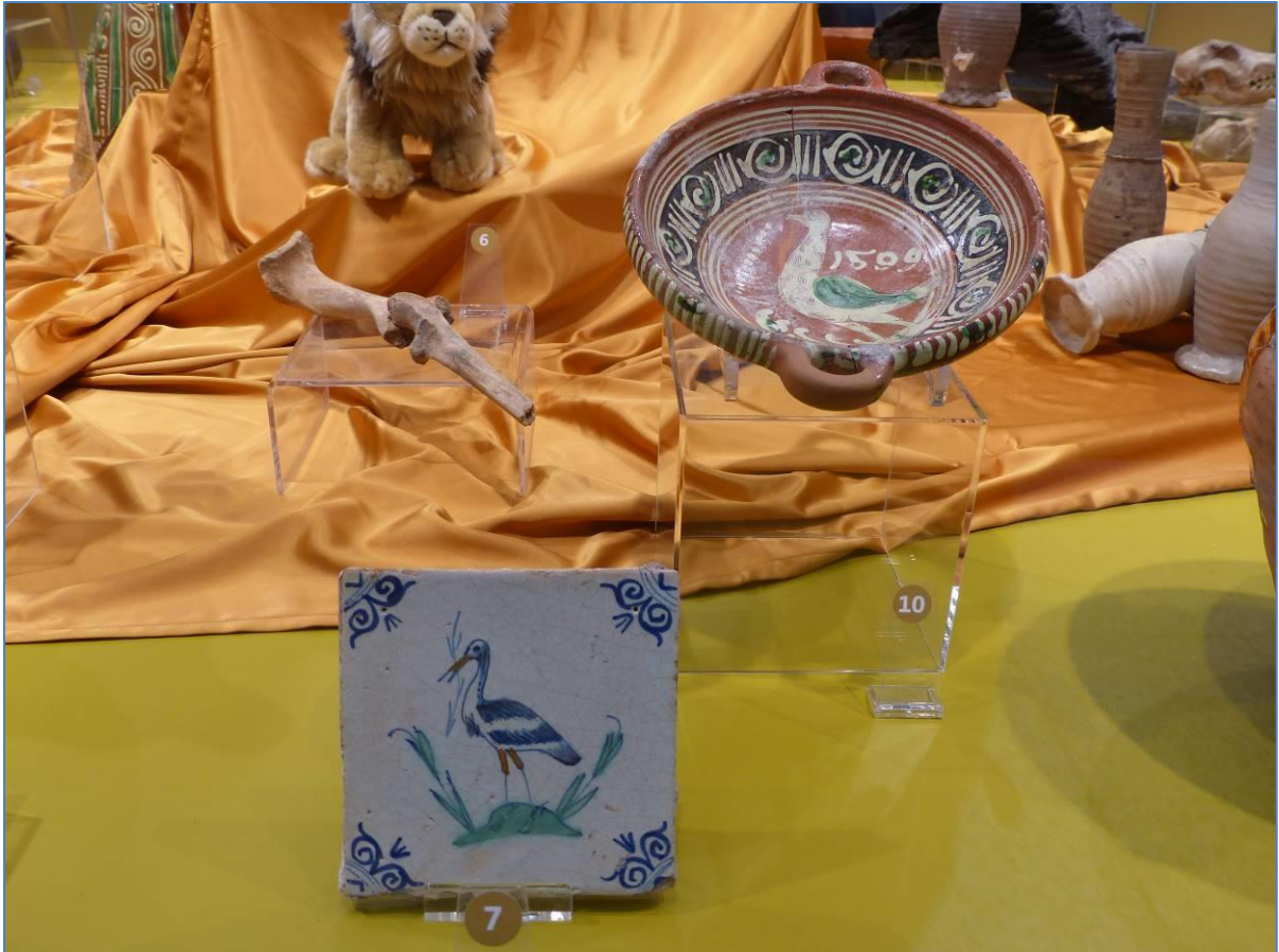
Twee leeuwenbotten (No.6), wandtegel met ooievaar (No.7), Werra schotel uit 1599 (No.10)