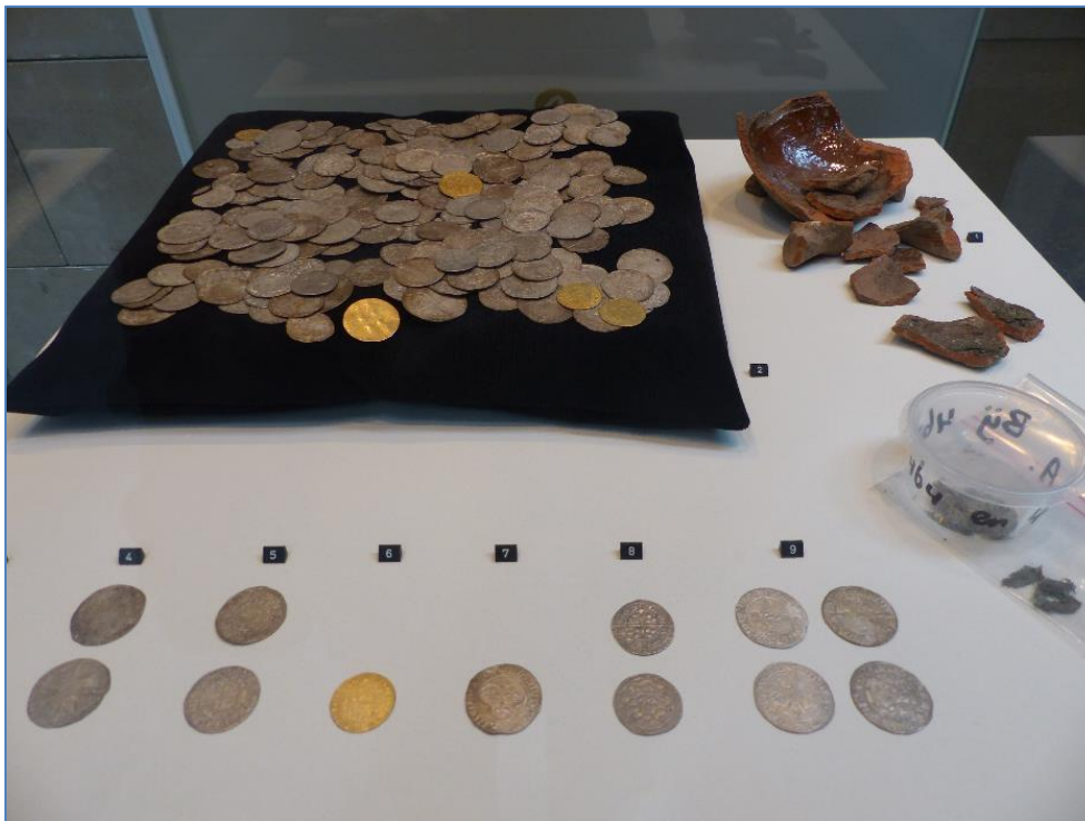
Muntschat, textiel in doosje en scherven van de kookpot (grape)

In de vitrine van nieuwe aanwinsten was tot 4 december 2022 de door het RMO (Rijksmuseum van Oudheden) aangeschafte muntschat van Hagestein te zien. Een grote muntschat van laatmiddeleeuwse zilveren munten en een enkele gouden munt. In totaal zo'n kleine 500 munten verpakt in textiel en daarna in een kookpot (grape) verstoppt.