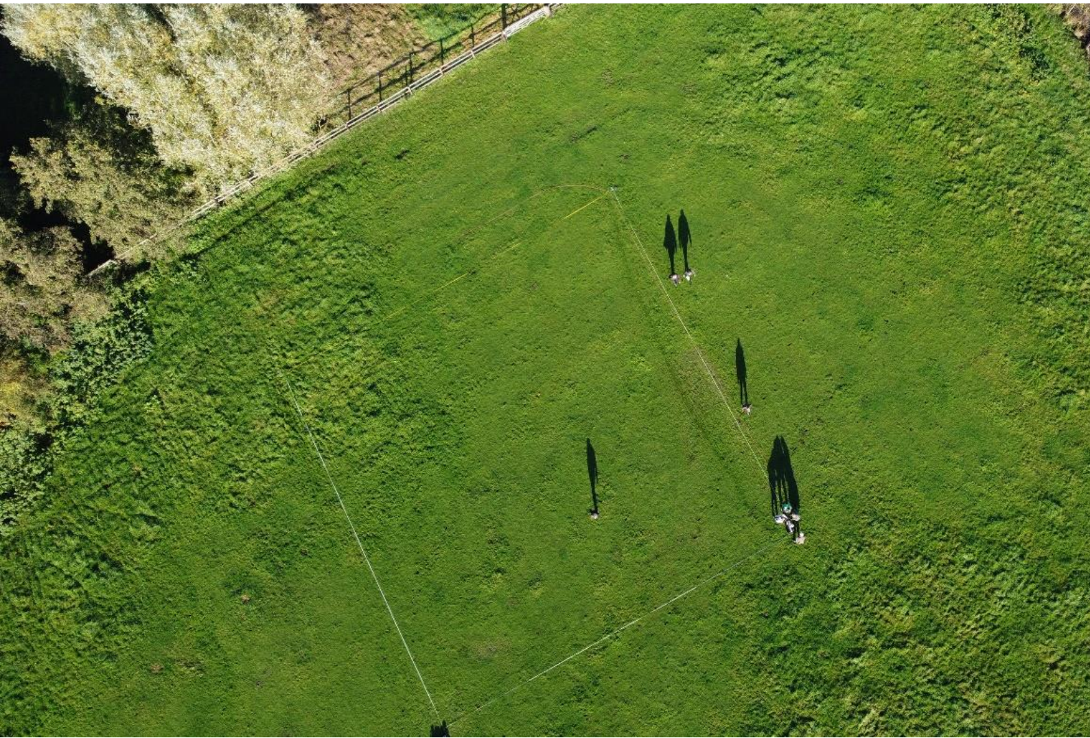
De AWN bezig met de grondradar in een 25x25m vlak