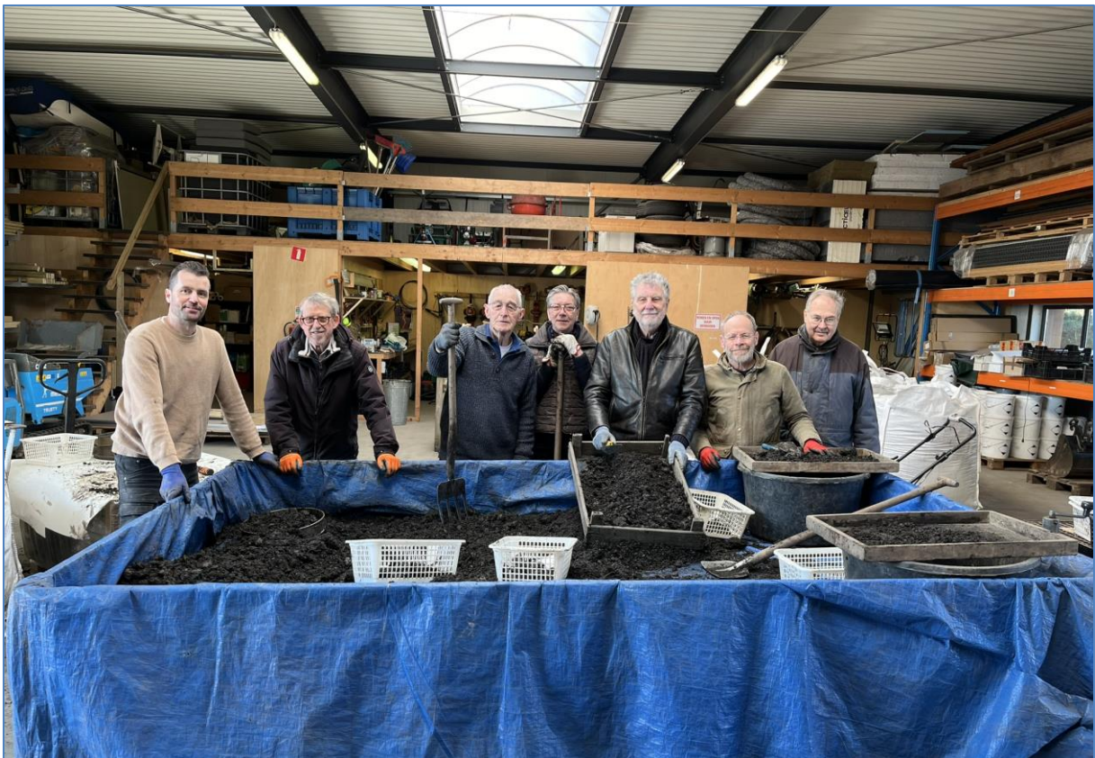
Klaar om te beginnen met de bigbags van de Visfontein.

Graag tot ziens op maandagavond 15 april!