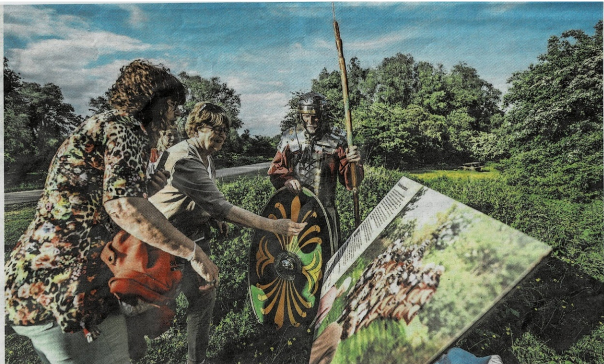
▲ Onder het toezien van een Romein bekijken bezoekers het nieuwe informatiebord over de Bataafse opstand.