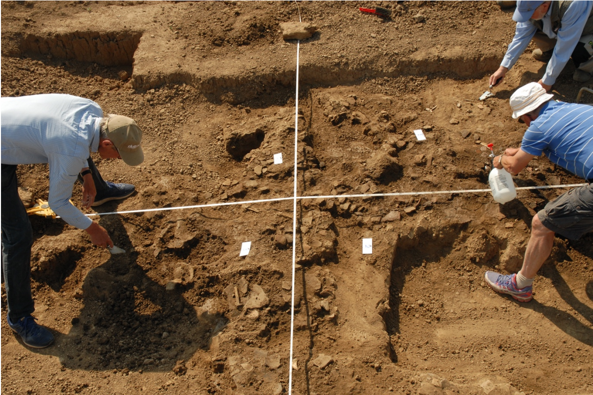
concentratie ijzertijdscherven in put 2 Geitenwaard.