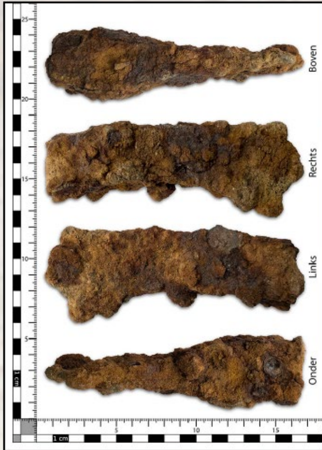
Ijzeren bijl, gevonden op de Eng langs de Hollandseweg.

Begin februari bereikte ons de melding van de vondst van een verroest stuk ijzer. Het werd aangetroffen op diepte van iets meer dan een meter bij het aanleggen van een ondergrondse bekisting op de Eng langs de Hollandseweg. Het blijkt te gaan om een bijl. De vorm en vondstomstandigheden doen vermoeden dat het hier wel eens zou kunnen gaan om een vroegmiddeleeuwse bijl, mogelijk een 'francisca'. De vondst werd overhandigd aan de regio-archeoloog en wacht nog steeds op determinatie.