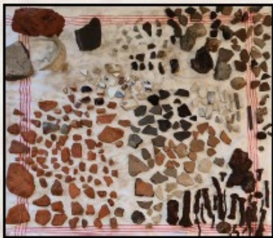
Het resultaat van een paar uurtjes zeven.

Eén scherf dateert uit de vroege bronstijd en is versierd. Ook zijn er verschillende vuursteenafslagen gevonden, waarvan sommige van één en dezelfde kern zijn afgeslagen. Dit duidt op bewerking ter plaatse, in de steentijd.