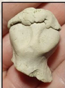
Het lijkt haast een gestileerd hoofd, maar het bleek uiteindelijk een productierest.

In november kwam een melding van een moestuinder aan de Dolderstraat, hij had op zijn volkstuin iets gevonden dat hem aan een stuk van een aardewerken figuurtje deed denken. Nader onderzoek door de WAW wees uit dat het om een stuk gebakken pijpaarde gaat. Het is echter geen onderdeel van een oud figuurtje, maar een relatief recente productierest.