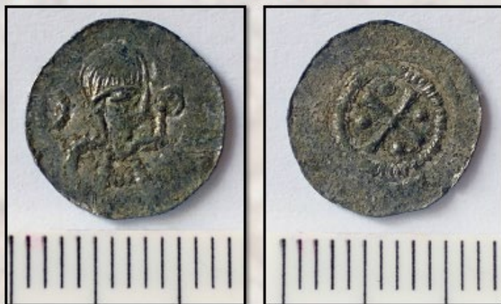
De bisschoppelijke penning uit ca. 1100.

In april werd er melding gedaan van de vondst van een zilveren muntje, op de Westberg. Dit is opvallend, omdat er in 1860 een cluster van dergelijke penningen werd gevonden op de Westberg. De laatste vondst is echter van een iets ander type. Deze penning dateert van rond 1100, betreft een anonieme Utrechtse bisschop en zou geslagen moeten zijn in de kop van Noord-Holland of langs de voormalige zuiderzeekust. Het heeft een diameter van 12mm.