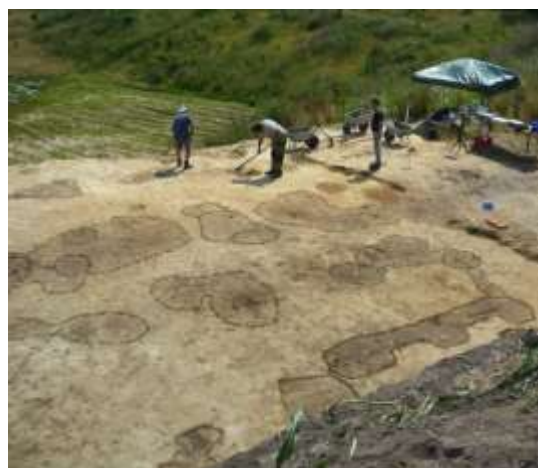
paalsporen van boerderijen in Visbek