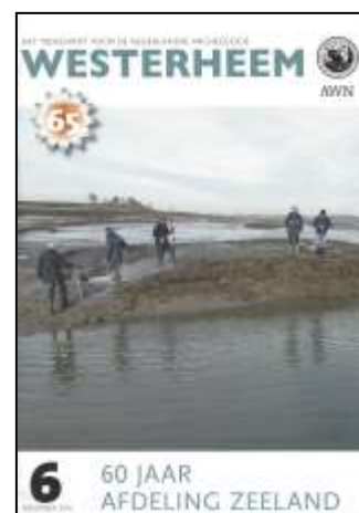
de laatste Westerheem

In maar liefst 24 uitgebreide, verrassende en soms zelfs spraakmakende artikelen over de Nederlandse archeologie kwamen diverse opgravingen en onderzoeken aan de orde, variërend van 17e-eeuwse pispotten in Noord-Holland tot middeleeuwse veenontginningen in Zuidwest-Friesland. We sloten deze gedenkwaardige jaargang van ons vertrouwde blad waardig af met een maar liefst 80 pagina's dik nummer, voor het overgrote deel gewijd aan mooie en uiterst lezenswaardige artikelen vanuit onze jubilerende afdeling Zeeland.