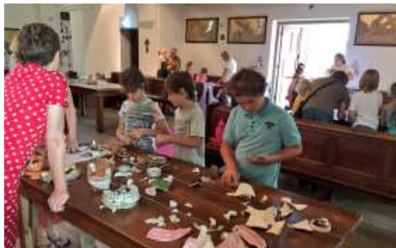
jeugdig enthousiasme in De Steeg

Er werd enthousiast geplakt, gepuzzeld en buiten in het zand gegraven. Zeker iets om te herhalen.