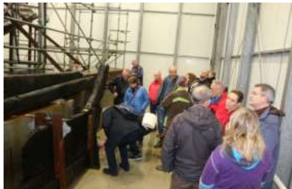
bezoek aan de IJsselkogge

Voorts werd met Saxion overlegd over samenwerking bij de opleiding onderwaterarcheologie en was de LWAOW mede-organisator van en deelnemer aan het op 18 november bij de RCE gehouden symposium "Vrijwilligers in de onderwaterarcheologie".