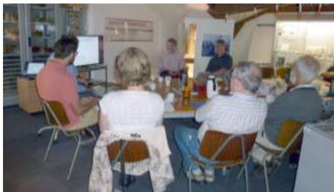
bijeenkomst in Houten