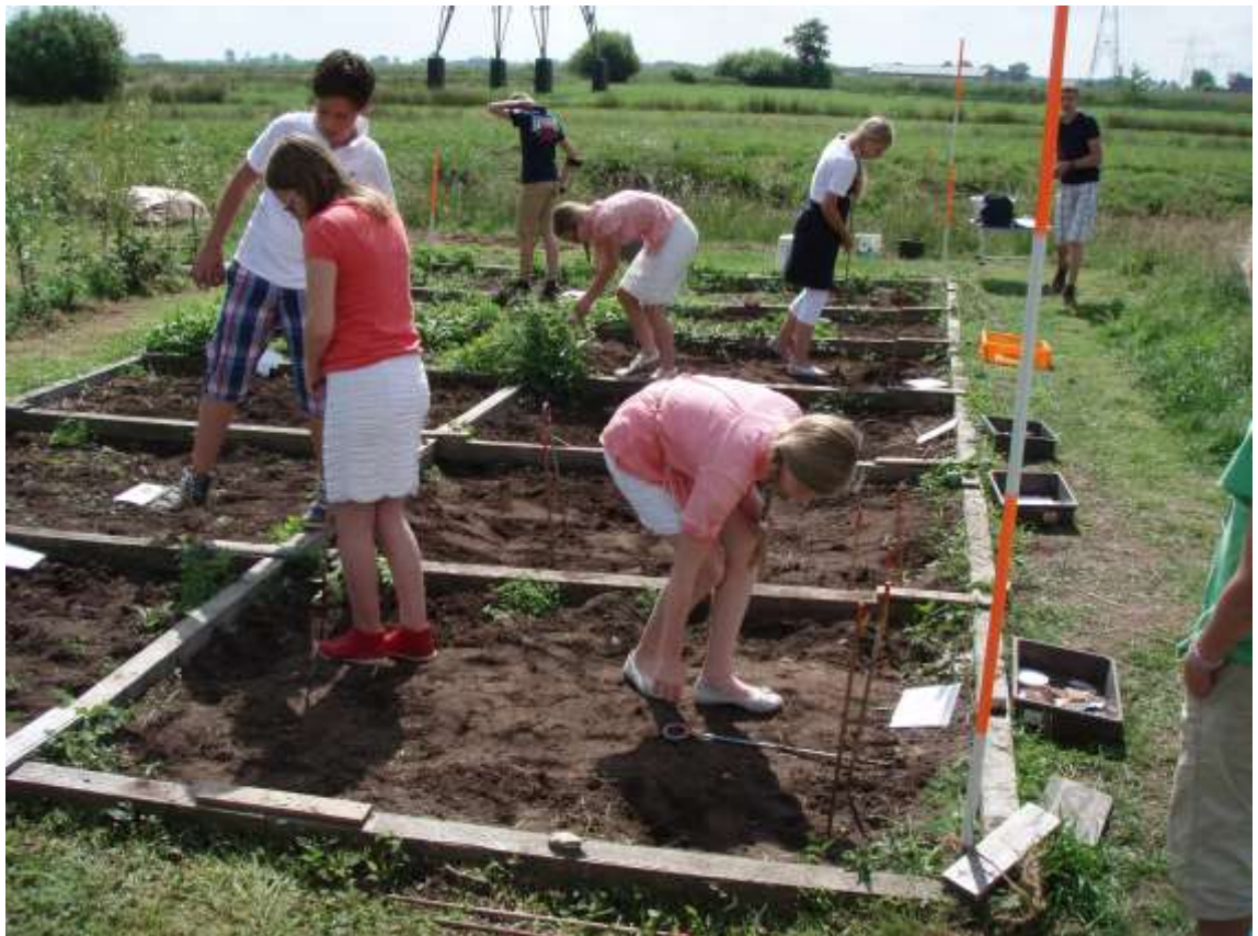
archeo-ontdekveld voor de jeugd