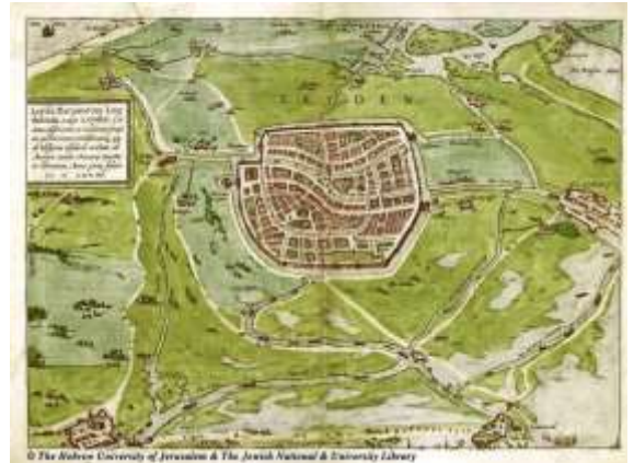
Leiden in de tijd van het Leids Ontzet

Daarnaast werd door de werkgroep tijd en aandacht besteed aan samenwerkingsverbanden in Zuid-Holland, lezingen, PR, krantenartikelen, belangenbehartiging. Dit laatste blijkt en blijft een proces van vallen en opstaan. Met Alphen aan den Rijn loopt het weer redelijk; in de Bollenstreek wordt gewerkt aan een intergemeentelijke archeologische werkgroep.