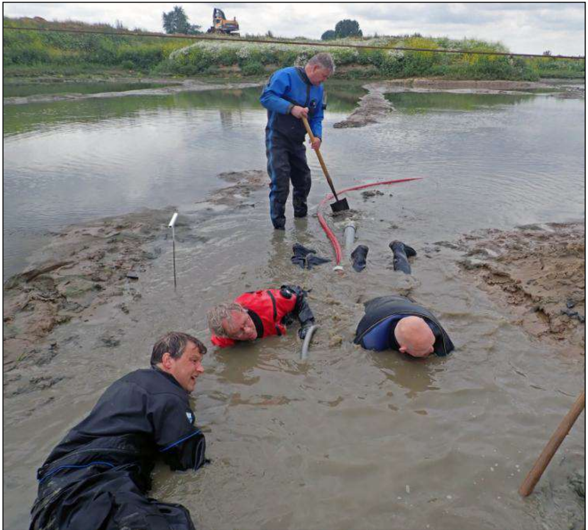
Onderzoek naar ons maritiem erfgoed in de modder! Geen probleem voor LWAOW'ers.