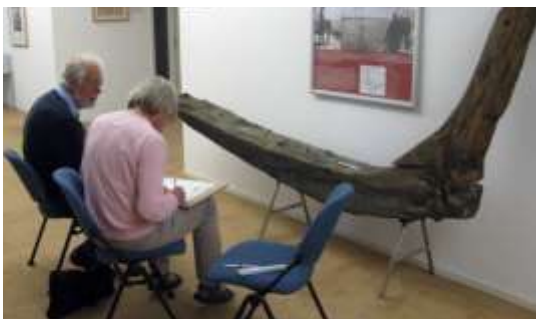
het tekenen van scheepshout

Na Duikvaker meldde zich een aantal nieuwe leden AWN-LWAOW aan en tevens deelnemers voor de Basis cursus Maritieme Archeologi