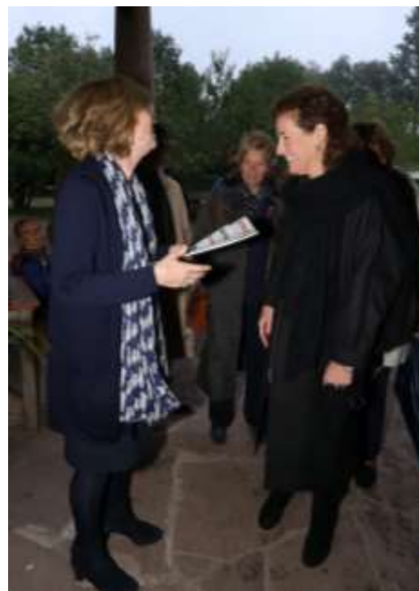
overhandiging van onze tijdschriften aan minister Van Engelshoven

Het adviseren van plaatselijke afdelingen en werkgroepen vormt voor hen een steun in de rug en geeft vaak net dat zetje, dat nodig is. Inschakeling van de werkgroep betekent overigens niet dat altijd het gewenste resultaat wordt behaald. Dat is vaak ook afhankelijk van andere factoren.