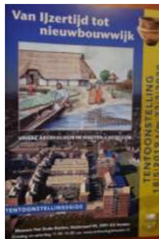
tentoonstelling en publicatie, mede-gefinancierd door het AWN-Archeologiefonds

Tenslotte heeft de Stichting zich garant gesteld voor een bedrag van maximaal € 3.250 voor de publicatie van "Groesbeek Heights" en de feestelijke aanbidding hiervan door Afdeling 16 (Nijmegen). Zie ook het "Jaarverslag Stichting AWN-Archeologiefonds" en www.awn-archeologiefonds.nl .