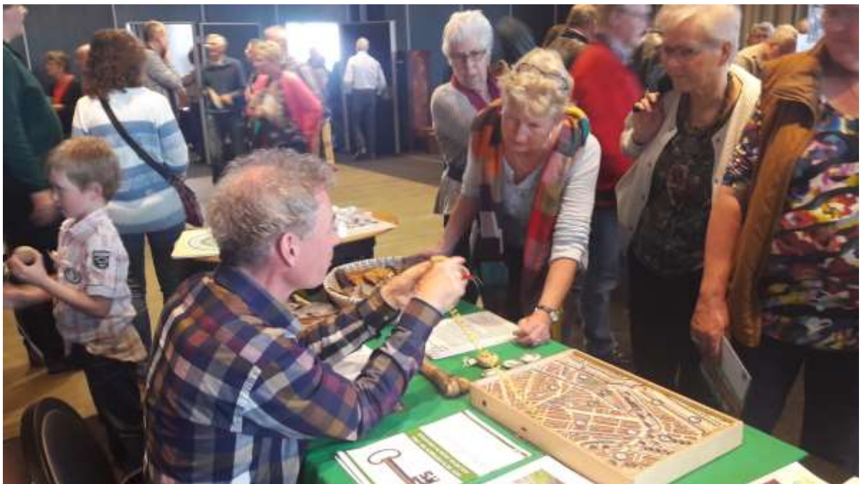
Afdeling 2 (ALWH-AWN) was succesvol actief op de Westfriesedag in Hoorn