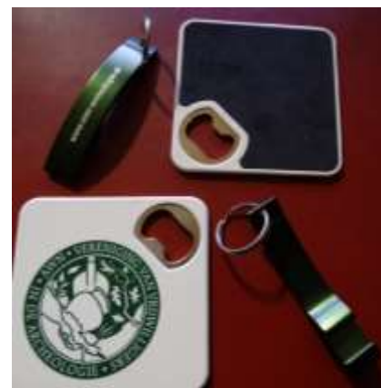
flesopener/onderzetters en flesopener/sleutelhangers

Ook werden dit jaar enkele nieuwe relatie-artikelen geïntroduceerd, door alle afdelingen te gebruiken bij activiteiten en acties. Van onze mooie landelijke stand werd gebruik gemaakt op de Reuwendagen (21-23 november 2019), de Nationale ArcheologieDagen (11-13 oktober 2019, door afdeling 24, Midden-Brabant in heropricting ) en op de Munt-manifestatie in Houten (21 september 2019). Medio 2019 heeft de landelijke stand enkele maanden in Oldenzaal gestaan in museum Het Palthe Huis (inmiddels ook een ArcheoHotspot).