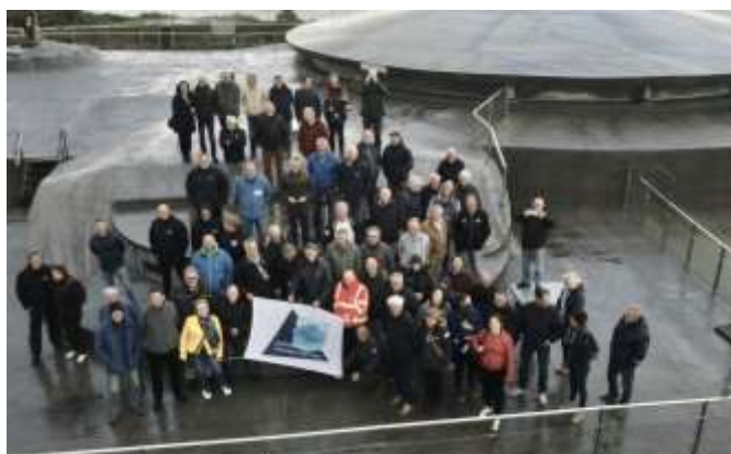
enthousiaste deelnemers aan de jubileumschervendag

De uitgevoerde activiteiten gaven aanleiding tot een lichte vorm van tevredenheid. Zoals in het gehele land was er ook bij de LWAOW sprake van vergrijzing, bij de LWAOW gelukkig (nog) niet onoverkomelijk, zeker met de ledenaanwas in 2019: van 200 naar 216.