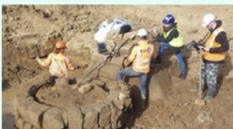
Professionele en vrijwillige archeologen werken samen in Herwen/Hemelning 2022

Locatie: Erfgoedcentrum Rozet, Kortestraat 16, 6811 EP Arnhem