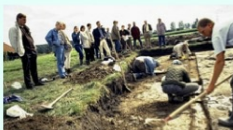
Professionele en vrijwillige archeologen werken samen in de Schuytgraaf, 1998