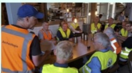
Professionele en vrijwillige archeologen werken samen in de Schuytgraaf, 2020